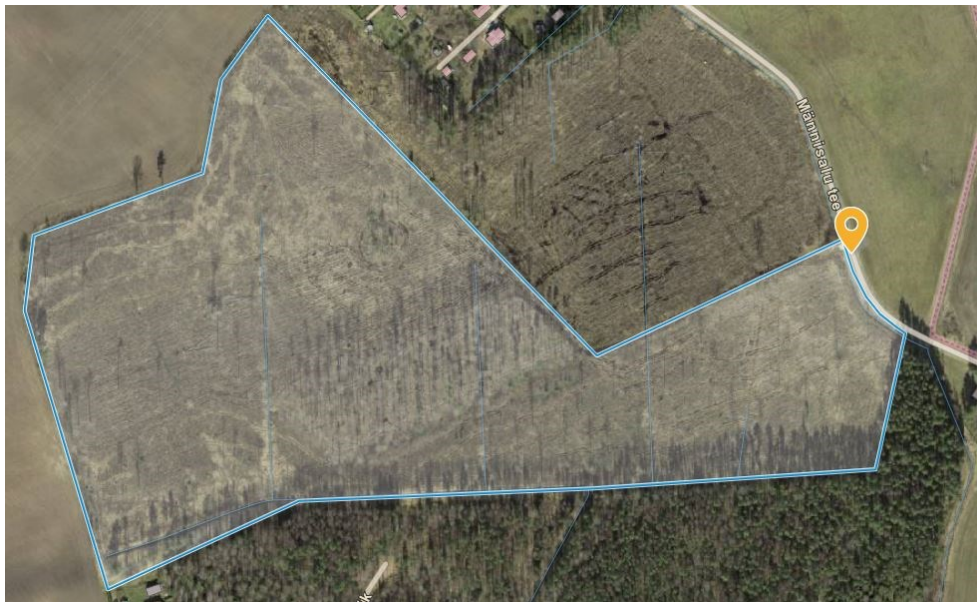
Joonis 2. Soovitatava juurdepääsu (ristumiskoht) asukoht